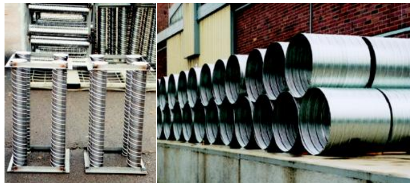
Aussparungs-/Verdrängungsrohre D= 1,0 m; L= 1,0 m Cavity / displacement piping D = 1.0 m; L = 1.0 m

MSL cavity piping is watertight so that no cement paste can later penetrate during vibration.